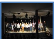
Licht, Ton, Vorhänge und Verdunklung für das Forum