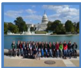
Förderung für Klassen- fahrten